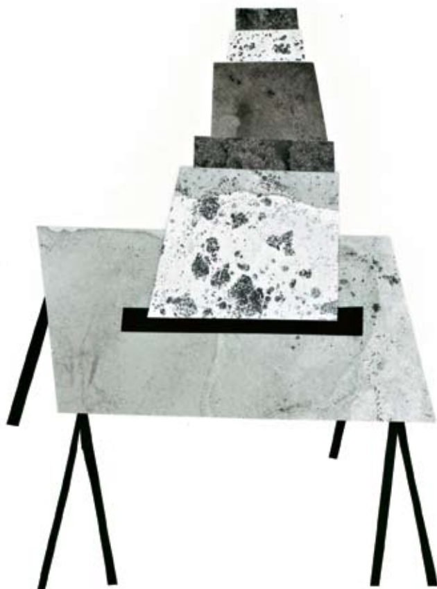
Sopra Spade Table 2 nell'interpretazione grafica di Faye Toogood.

più oscuro del mondo naturale, riuniti nella nuova collezione Assemblage 2 .